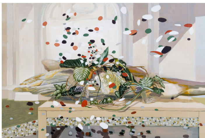
Hsu Yinling 許尹齡，They Have No Choice 他們別無選擇, 2021, Oil on linen, 47 1/5 × 70 9/10 in 120 × 180 cm, Courtesy of the artist and Project Fulfill Art Space

「藝術可以是一股療癒、宣洩、甚至了解你的力量，應該不只是看了覺得漂亮舒服而已。」對許尹齡來說，儘管身處在這個人類世界廣泛發生競爭、爭奪的焦慮時代，儘管最終還是無法改變令你我不快的現實，但不代表沒有其他辦法可以在從心裡做調適，在精神上放下它。