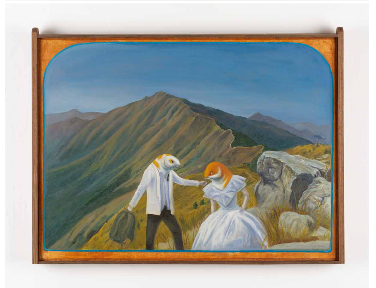
LEFT PAGE 《你的蘭花在哪裡？》· OIL ON CANVAS · 91.5 X 91.5 CM · 2021